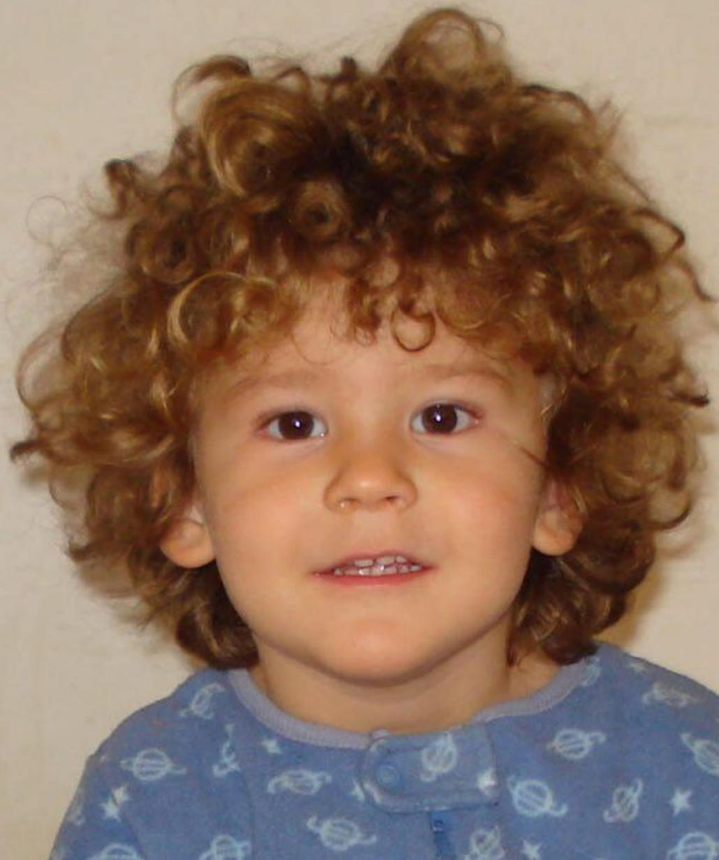
Copil luminos și vesel după începerea dietei specifice Fenilcetonuriei